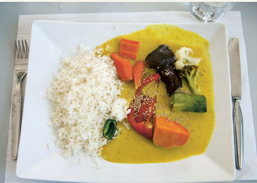
Mit einfachen Zutaten wird den Gästen eine gute, schmackhafte Mahlzeit serviert.

Ende der 1990er-Jahre organisierte Max Zeller während der Wintermonate im Neuwiesenhof eine Gassenküche. Das Angebot richtete sich damals in erster Linie an Suchtkranke.