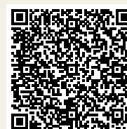
Spenderkonto QR-Code scannen

www.huelfsgesellschaft.ch info@huelfsgesellschaft.ch